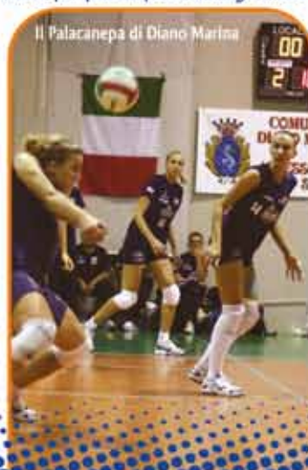
Il Palacanepe di Diano Marina