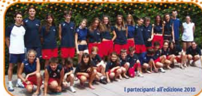
I partecipanti all'edizione 2010